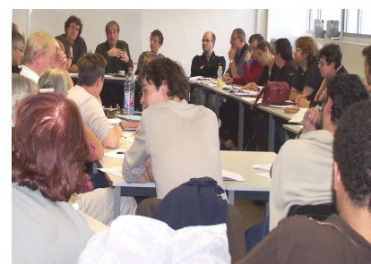
Réunion sur la réforme des lycées à la section académique

Cette exigence de démocratie est gage d'efficacité syndicale afin de construire l'action la plus large et la plus massive possible. C'est dans ce but que le SNES organise des stages et des réunions aux niveaux départemental et académique (ouverts à tous, syndiqués et non syndiqués) et participe, à la demande des établissements, à des réunions (heures mensuelles d'information syndicale par exemple).