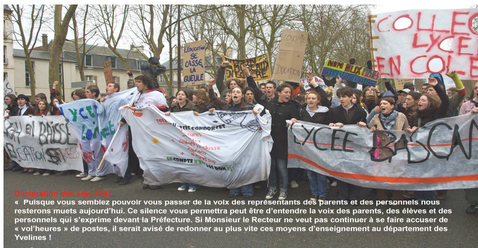
Démonstration des élus FSU

Attaché à la démocratisation du système éducatif, soucieux de la réussite de tous les élèves sur tout le territoire en particulier dans les zones d'Education prioritaire, le SNES a combattu toutes les réformes qui se sont mises en place depuis 2005 (Loi Fillon en collège, réforme actuelle du lycée, création des établissements ECLAIR...), qui ont pour logique le tri social et aboutissent au renforcement des inégalités sociales (assouplissement de la carte scolaire) et à la stigmatisation des élèves issus de milieux défavorisés et de leurs familles.