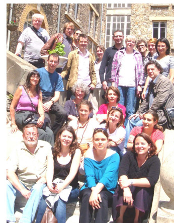
Les élus du SNES-FSU au Rectorat durant les commissions d'affectation intra 2012

C'est pourquoi les élus du SNES agissent toujours en tant que représentants de l'ensemble de la Profession et ont toujours le souci d'exiger, en face d'une Administration qui se complait de plus en plus dans l'arbitraire et l'opacité, la transparence et l'équité de traitement pour chacun et pour tous. Les CAPA sont aussi le lieu où nos élus portent les revendications du SNES en matière de carrière, de gestion et de règles du mouvement, n'hésitant pas à s'opposer à l'Administration, ce qui peut, par blocage de cette dernière, provoquer des conflits importants (notamment lors du mouvement intra ou de la hors classe).