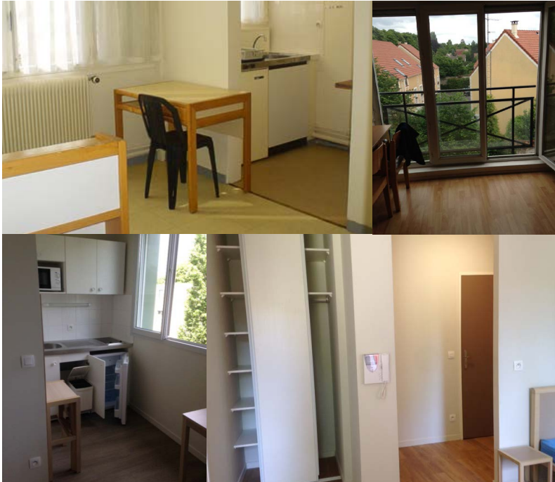
Exemples de logements proposés

La location meublée doit porter sur un logement muni de tout le mobilier nécessaire à l'habitation. Cette modalité de location est encadrée par la loi Alur de mars 2014. Ces logements permettent à de jeunes actifs âgés de 18 à 30 ans (voire au-delà) de louer des studios et des T2 meublés en région parisienne. Le montant mensuel des loyers s'élève de 450 à 600 € toutes charges comprises (eau, chauffage, ...).